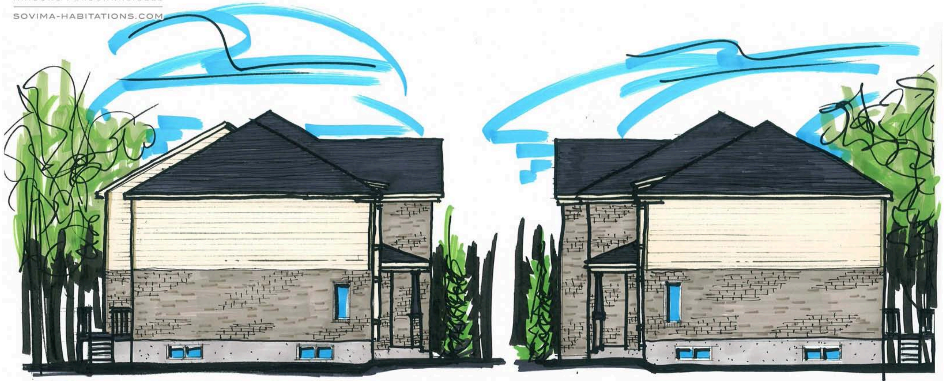
Élévation Latérale Gauche